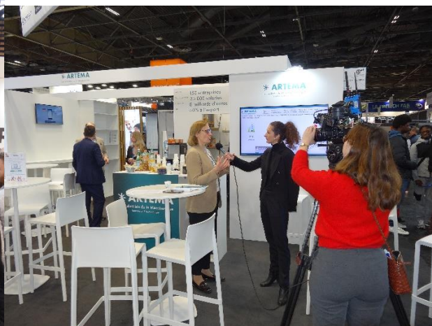
Interview sur stand GI Paris 2024