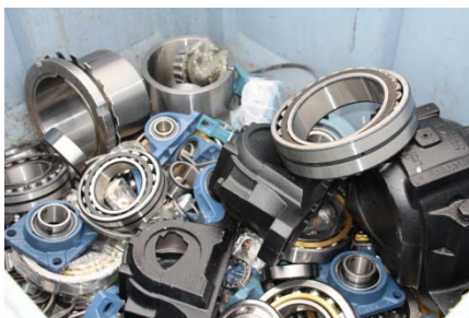
Faux-roulements saisis au Havre en 2015