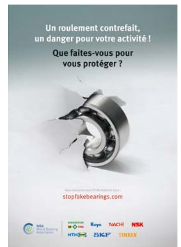
Affiche campagne stopfakebearings

L'association mondiale des roulements WBA (World Bearings Association) a développé un site multi-langues consacré à la campagne contre les faux-roulements : www.stopfakebearings.com