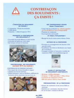
Panneau et vitrine Artema à l'Exposition contrefaçon : Faux-fuyons (30 mars-30 avril 2017) au Cetim, Senlis